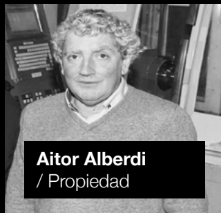
Aitor Alberdi / Propiedad